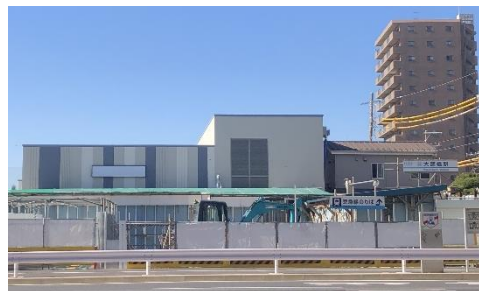
現在の大師橋駅 （令和5年12月8日撮影）