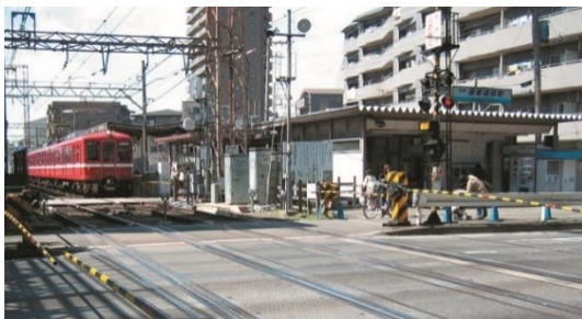
旧 産業道路駅（現 大師橋駅） （平成20年頃撮影）