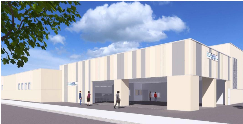
大師橋駅駅舎完成イメージ